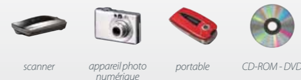
scanner appareil photo numérique portable CD-ROM - DVD

La METAZA est très facile à utiliser. Le premier pas est d'acquérir une image numérique sur votre ordinateur avec un scanner, un appareil photo numérique, un téléphone portable ou CD-ROM/DVD